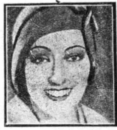
Η Γκλόρια Σβάνσον, κατά τελευταία φωτογραφία της

«Όποιος τοῦς δριχῶς σου γρικῶ, τὰ λόγια σου πιστεύει, καί θέλασσα πίνει λαγούς, καί στὰ θουὰ ψαρεύει!