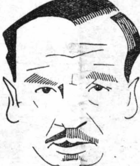
Ο Ουάλλας Μπήρυ, ὁ πρώτος σιζύγος της Γκλόριας Σβάνσον