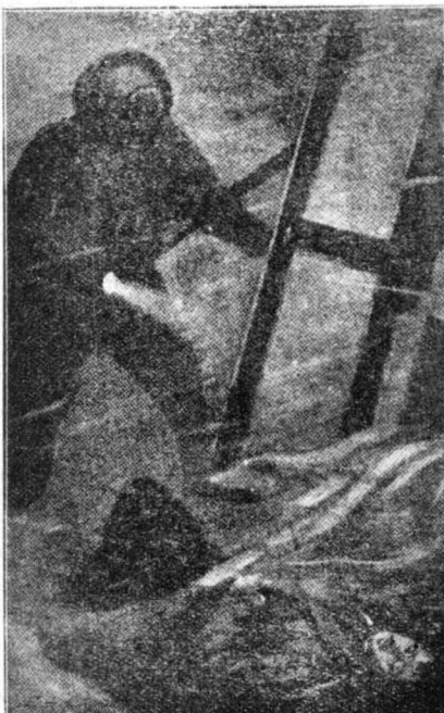
"Ενα πτώμα νεαρού άνδρός ήταν έσπλωμένο στο κάτω μέρος τής σκάλας...

—Δεσποινίς, στις εκμιστηρησεις σας δυό πράγματα βρήκα κάπως σοβαρά : Πρώτα τις χρηματικές δοσοληψίες του μνηστήρος σας με τόν κ. Λουξίλ. Κι' ύ- στερα, τή σύμπτωση - άόριστη δυτυχώς - του ναυαγίου τής θαλαμηγού του άρι- θώς κατά τις ήμέρες αυτές τής έξαφάνι- σεως του πλείστου μου. "Ησυχάζει τώρα. Πηγαίνετε στο σπίτι σας να κοιμηθήτε, κι' έγώ, από αύριο πρωί κιάλας, θα άσχο- ληθώ με την ύπόθεσί σας !..