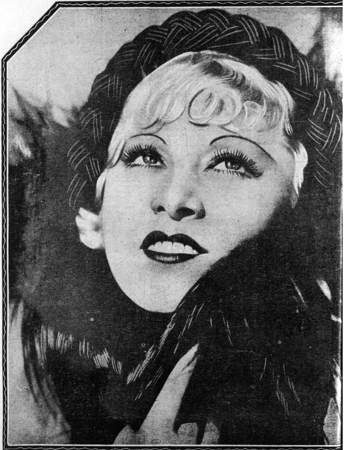
ΑΡΙΣΤΕΡΑ : 'Η περίφημη «βεντέτα» Μαίη Γουόκερ, η γυναίκα που έχει αναστατάσει την 'Αμερική, όπως εμφανίζεται στο φιλμ «Θέλω να γίνω Λαίδη Πτελιματάς», στο φιλμ «Καλή Τύχη», και ό Ζάκ Κρεττιγιά, στο ρόλο "Αρ"