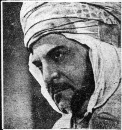
ΔΕΞΙΑ ΕΠΙΛΗΨΗ : 'Ο άρσενος και άθλητικός πρωταγωνιστής του ελάει θ - Ντάμερ, Ζάν Πιέρ - 'Ομόν. — ΔΕΞΙΑ ΚΑΤΩ : 'Η Γαλλίς εβενέττα Ζακελίνα ... στο φιλμ ε'Η Καταγίρα.