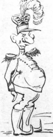
Φόρεσε και καθοῦκι στὸ κεφάλι, με λοφίο ψηλό...