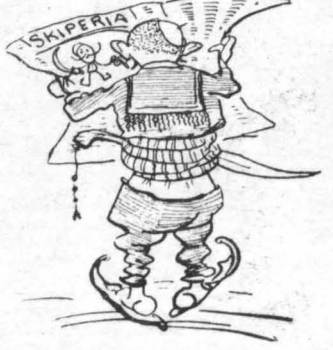
Ὅλας ἡ ἐφημεριδες ἔγραφαν κ' ὁ κόσμος με ἐνδιαφέρον διάβαζε...

—Ἀχ ! πράσσα μου ἀγαπητῆ, πὸν ἔχετε και σεις λοφίο σάν κ' ἔμνευ !..