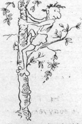
—Ἀχ ! πράσσα μου ἀγαπητῆ, πὸν ἔχετε και σεις λοφίο σάν κ' ἔμνευ !..