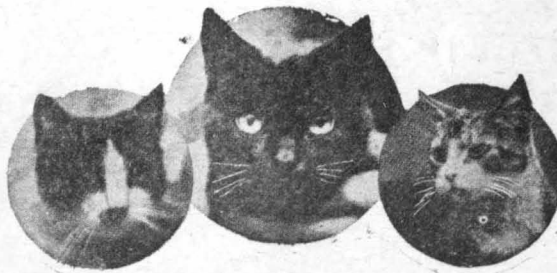
ΑΠΟ ΤΑ ΞΕΝΑ ΠΕΡΙΟΔΙΚΑ

Ε ΝΑΣ από τους πιο μεγάλους ψυχολόγους της γυναικείας καρδιάς, ο μαρκήσιος γι' α λα Φορέλ στ' ε' Απορμηνομενιάτι τους λέει κάποιον ότι η γυναίκα μοιάζει σαν τη γάτα: όταν πρόκειται να σου ζητήσει κάτι ξεχεται κοντά σου! Κι' αυτή, αλήθεια, η παρομοίωση είναι σωστή. "Ετσι μονάχα εξηγείται και η υπερβολική αγάπη των γυναικών σ' αυτά τα κατοικίδια ζώα, τα οποία δεν κάνουν άλλη δουλειά από το να κοιμούνται κατά κρεβάτια, ν' ακονίζουν τα νύχια τους στα έπιπλα και να κάνουν την τουαλέτα τους πάνω στα μεταξωτά μαξιλάρια του γιβασιού. Υπάχθουν όμως και γυναίκες, η οποίες αγαπούν τις γάτες, όπως τα παιδιά τους κ' ανομήνουν από τα καλύτερα.