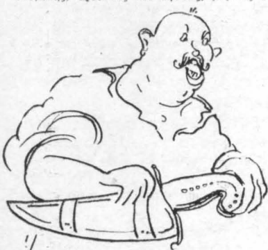
Έμειναν με άνοιχτό το στόμα !..

Ο κόσμος άνεβοκατέβαινε στο δρόμο του «Σταθίου». Κόσμος και κοσμάκης, άρσενικός και θηλυκός, μεγάλος και μικρός, πλούσιος και πένις, άρχοντες και άμαρτωλός. Ένα πυχτό ποτάμι περιπατητών, που πηγαυνοροζότανε με τον ίδιο ρυθμό και την ίδια κίνηση, σαν μηχανή έργοστασίου. Σκόνη, τόξα, ζέστα, ιδρώτας, στενωγόρια, διαγκωνισμός, μα και επίδειξις, και απόλαυσις, και ικανοποίησις και ευτυχία για τους περιπατητές. Έκθεσις, θα νόμιζε κανείς, προσώπων, απόμων κοουτουριών. Καθένας ήταν και εκθέτης και έκτιμητής. Έξέθετε τον εαυτό του ο έπίδειξι και έκανε και κατέκρινε τον άλλον την έμφάνισι και π