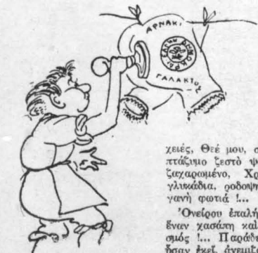
Το παιδί έβαλε τη σφραγίδα...

Τα στεγνωμένα ρούχα παίζαν με τ' άεράκι κι άναδεινόντουσαν πολυήχορα κομπιναζόν. σαν δειλιές νεράδες, που η χορευόνε κοντά στον ποταμό και παίζουσε και νηρηγόντουσε. Θεέ μου !.. Τι πειρασμός και ταραχή, για τον πόλταμο χασάπη, που γούφλωνε τα μάτια του και σε κάθε νυχτακό άνέμωμο έβλεπε και μια εικόνα γυνικών σωμάτων και προκλητικών, μόλις από τα κομπιναζόν καλυπτομένων, που αναλιώνονταν μπροστά του και λαγγεύανε κι παίζαν, και τον προκαλούσαν και άνευροδίδοντο !..