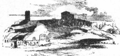
Ἡ Ἀκρόπολις (Σκίτσω ξένου περιηγητοῦ)