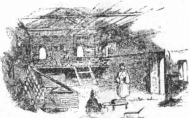
Ἐσωτερικὸ σπιτιοῦ στὴν Ἀνθρου (Σκίτσω ξένου περιηγητοῦ)