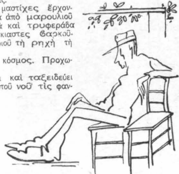
Κουρασμένοι, σκοτωμένοι οἱ στρατιῶτες ἀπὸ τὰ γυμνάσια...