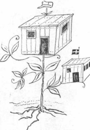
Φυτρώσανε σάν μανιτάρια...