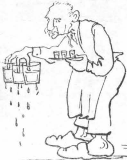
Κρατώντας τὰ ποτήρια, μὲ τὰ δάχτυλα βουτηγμένα μέσα στὸ νερό...

Πῶς φυτρώσανε, σάν μανιτάρια, γύρω ἀπὸ τὸ σύνταγμα!... Σανιδοσκεπή καὶ σανιδόκτιστα, ἀποθεοῦνται μέσα σὲ σύννεφα μυγῶν!... Ἀκούρευτοι, ἄπλοιοι, ἀκάθαρτα οἱ ἰδιοκτίηται, ἀργοὶ καὶ θραυκίνοι, ἀναδουνοῦνται, σάν τὰ σκουλήκια, ἐκεῖ μέσα, ἔτοιμοι νὰ θουτήξουν τὰ ἀκάθαρτά τους χέρια μέσα στὸ ποτήρι τοῦ νεροῦ, πού θὰ σοῦ φέρουν, —κάθε... δάχτυλο ἐμβαπτίζόμενον συγκρατεῖ καὶ ἀπὸ ἓνα ποτήρι— μὲ τὸ γλοιώδες, τὸ θρεγμένο λουκουμάκι, ἢ τὸν κατὰ διά- πάρχει—ἢ τὸν κατὰ διάνοισιν, λέγομεν, καφέ. Παραπέρα τοιποτρίζει ἓνα τηγάνι, ἀναδιδουνοῦντας μιά δυσώδη κνίσσα, κατὶ τὸ ταγκό, πού καίγεται.