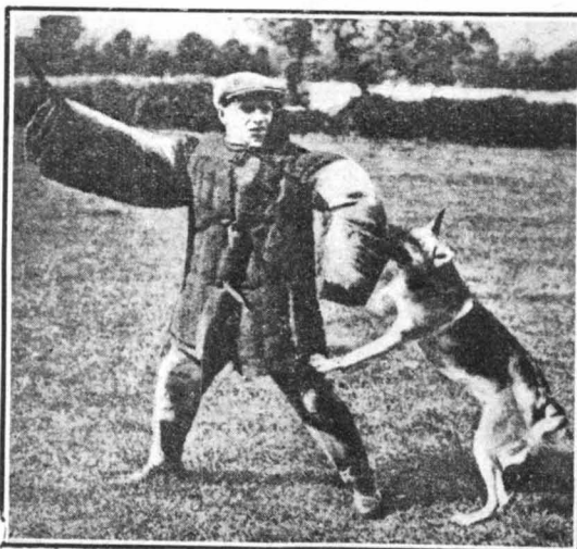
Ένας άστυνομικός, ντυμένος με χοντρές γοντρές, γυμνάζει ένα λαγωνικό της άστυνομίας

Σέ μία στιγμή ή «Τσάμπιον» άρχισε να μυρίζεται την άτμόσφαιρα κι' έπειτα να προχωρή άδίστακτα προς ένα τραπέζι, στό όποιο καθόταν ένα ζευγάρι. Ο κύριος ήταν ός τριάντα χρόνων, ύπερβολικά συμπληθικός και κάπνιζε άδιάστακα πούρα της «Αθάνας». Η φίλη του ήταν μία πλούσια κι' όμορφη γυναίκα, στολισμένη με κομμάτια μεγάλης αξίας. Ο «Τσάμπιον», όταν έφτασε κοντά στον κύριο, σηκώθηκε στά δύο του πόδια, άρχισε να μυρίζει τά ρούχα του και έξαφνικά έβγαλε ένα γαυγισμα χάρας. Ο συνοδός της όμορφης κυρίας γέλασε από τις έκδηλώσεις του θαυμασμού του άγνωστου σκύλλου και έκανε να τόν χαϊδέψη. Μά ή «Τσάμπιον» τόν άρπαξε από τό μανίκι και δέν έννοουσε να τόν άφήση. Ο άστυνομικός περιέργως πλησίασε κι' αυτός στο τραπέζι, δήλωσε την ταυτότητα του και παρακάλεσε τόν κομψό κύριο να τόν ακολουθήσει στό τμήμα.