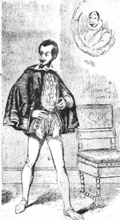
—Κατά τό μεσημέρι θά βρισκόμαί κοντά στήν έπαυλι τού Σαλαί, είπε ό Μωλουδ

—Λοιπόν, οέ συμβουλεύω νά τόν περιμένης έδω!... Και μόλις έρθη, νά τού πης νά έπιστρέψη άπό άλλη πύλη... Άπ' τήν πύλη τής Μοντιμάρτης, παραδειγματος χάριν!... Άκουσες;... Όχι άπ' τήν πύλη τού Σαιν-Ντενύ, γιάτί εκεί παραμονεύουν νά τόν πιάσουν! Είχε ύφος άπερίγραπτο ειλικρινείας ό