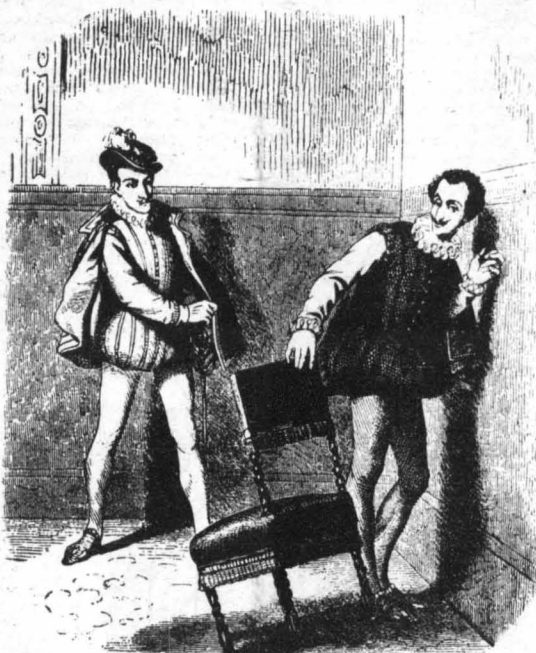
Πλησίασε στὸν τοῦχο καὶ κρυφάκουσε...

-Ἐδῶ, ὅπως φαίνεται, κάποιος χτυπήθηκαν!... Ποιοὶ ὅμως; Τί συμβαίνουν αὐτὰ τὰ σπασμένα κομμάτια τοῦ σπαθιοῦ;... Ποιοὶ ἦρθαν ἐδῶ;... Εἶνε μεσημέρι, τώρα!... Ὁ καρδινάλιος ἔπρεπε