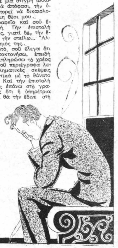
—Μητέρα !... Μητέρα ! Μητέρα !...

«Ήμουν άποκαταμένος πια από την ύπνρέρτρια...»