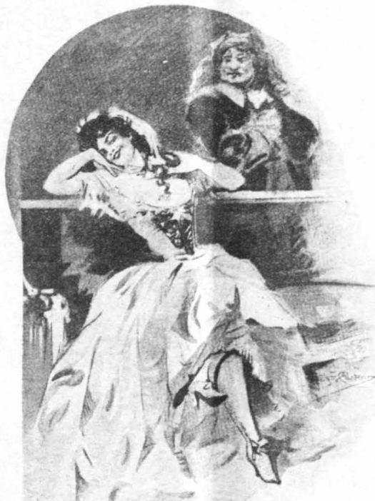
'Ο Ρασκάς τήν έβρωγε μέ τά μάτια...

—Αυτός ό Τραγκαθέλ, έξέρι και όργανώνει θαυμάσια τις προδοσίες του και τις παγίδες του!