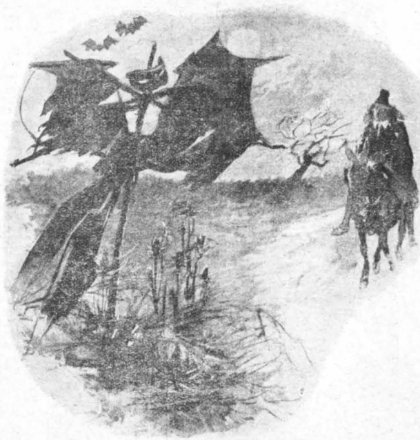
Ἦταν τόσο ἀπαίσιο, ὥστε ὁ καλόγηρος· κατάσκοπος φοβήθηκε...