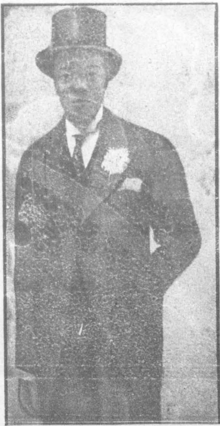
Ὁ μαῖσρος δόκτωρ Σωλλίδων

Ὁ περίφημος μαῖσρος δόκτωρ τῆς Νέας ὎ρκης Οὐίλλιαμ Σωλλίδων, ἕνας ἀπὸ τοὺς καλύτερους γιατροὺς τοῦ Νέου Κόσμου καὶ εἰδωλο ὄλων τῶν μαῖσρων τῆς Ἀμερικῆς, ἐβανότασε μὲ μιὰ λοχυρὴ ἐνεσι μορφήν τὸν ἐπι-