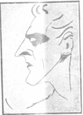
Εκίτος του Ίζον Μπαρμπορο, κωμωμο κι' ο τον Ντορόκλα Φαίρμανος υίον

Καθως θέλπετε, δηλαδή, ο μαύρος δόκτορ την έχει πολύ πολύ άσχημα!