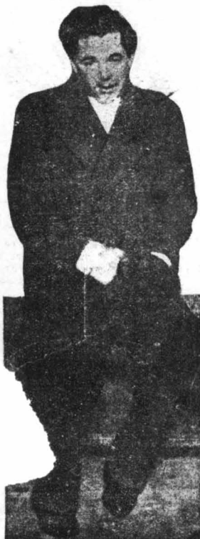
Ο Μπαλντάσαν Μοσκίνι