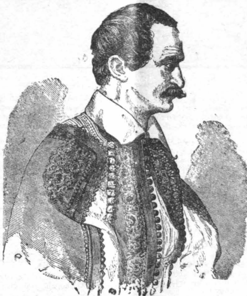
Ο βασιλεύς Όθων