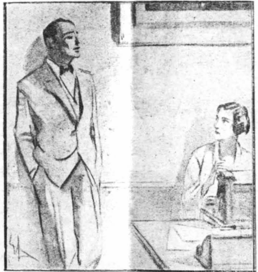
...Σέ κώταξα περιέργω, γιατί κάποια ύποψία μού βασάνιζε τό μυαλό!...