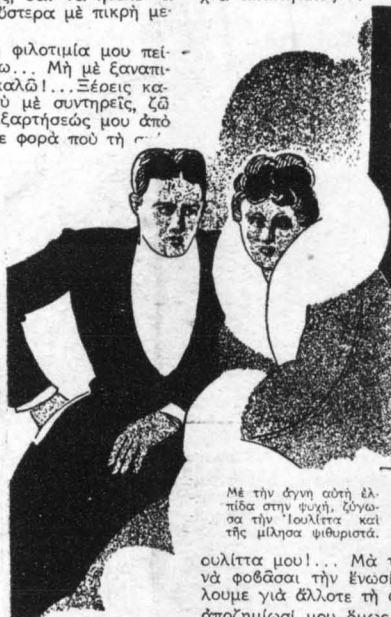
Μὲ τὴν ἄγνη αὐτὴ ἐλπίδα στὴν ψυχὴ, ζῶνα στὴν Ἰουλίττα καὶ τῆς μίλησα ψιθυριστά.