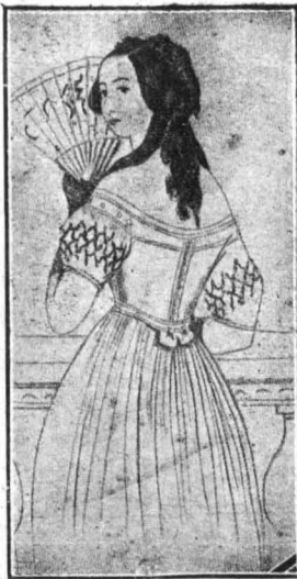
Η συγγραφέις τής «Θυσία στον Έρωτα», Γεωργία Σάνδη.