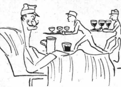
—Ζωή και κόττα. Σάν άγρόδες! ...

—Στό νοσοκομείο έμε; και ό εστρίφ—του; πηγαίνω! ... Έλεγαν. —Άς τά, άδέρφω, και όη γ ατρεπτόιμε τζάμα! ... —Φαί, κοιμηθό και ξαπλώσά! ... Γιατρέ; από τού πρώι ως τού βράδι. Και τί γιατρέ; ... Βασίλειος γιατρέ, σου λέει ό άλλος! ... Γιατρέ; με πλάκα τά γαλιόνα! ... Και χάρισμα τά γιατριά! ... Και νοσοκόμοι και νοσοκόμες; νά πάνε και νάχοντα! ... Κρεββάτι μόννα και θ ό ό! ... Ούτε στί σπύ του κανέναν! ... Θεέ μου, και τί μου δίνεις έτα, άφρωστεις έτα, κροχτώ! ... —Και είσα έφρωστος πολί! —Άφρωστος λέει; Σάππος; Τρέχα και στάζω άπ' όλες τις μεριές! ... Και νά σου πώ, σέ άδερφάκι; Μυρίζει λίγο, νά γώ τού σινηθισα... Τώρα δ