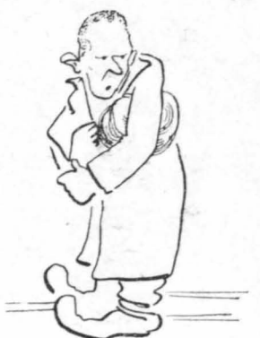
'Εθιγανεν ένας - ένας, σφόντοντας τις άρδούλες τους...