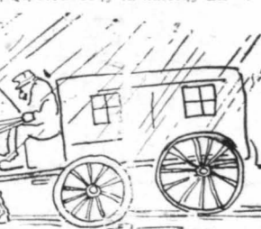
'Ενα μεγάλο κάρφο, κίτρινο και κλειστό...

Και πήδησα κάτω, εύχηθείς : —Καλή σηνάντηρή του με' άν... έαυτού του! ΣΤΑΜ ΣΤΑΜ.