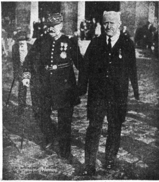
Ο άπόροχος έπιστήμων Σάρλ Βαγιάν, μετά την παρασημοφορία του, ανυποδέξιμος από τον στρατηγό Μεριώ

Κι' ωστόσο, ούτε ύστερ' από αυτά τά μαρτύρια, ο Βαγιάν έγ-