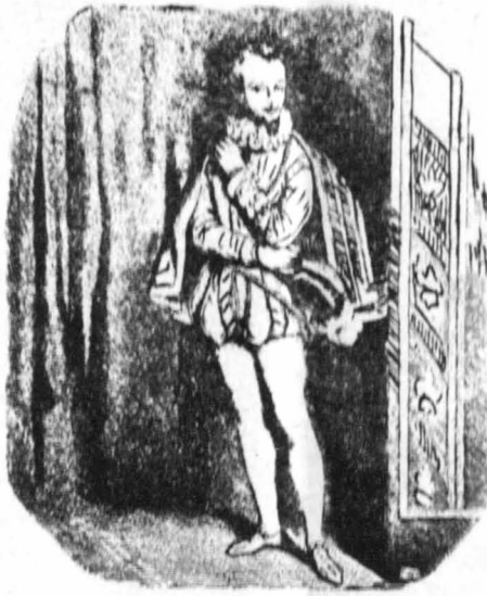
Ο βούς της Βανδώμης

Ο Ρασκάς, άκούγοντάς τα αύτά, σκέφτηκε κάτι πρακτικό-