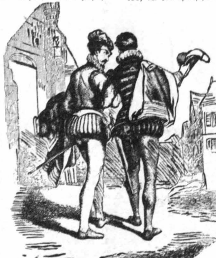
Οί δυό ευπατριδα βήγαν από θρόνο κ' άπομακρόνηκαν...