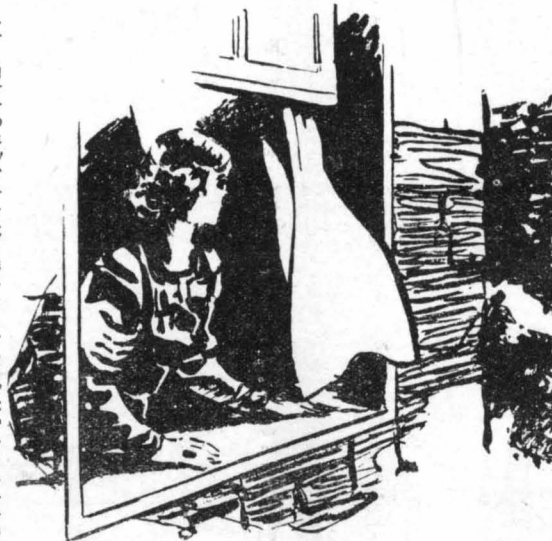
"Άνοιξε έξαλλη τὸ παράθυρο και κύτταξε κάτω...