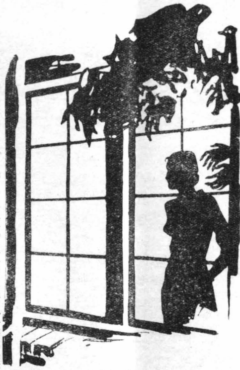
Στεκόταν πίσω από τά τζάμια, μέ τή λαχτάρα πώς θα τόν έβλεπε έξωφνα...

'Αλλά πάλι, να φταιή άραγε άληθινά ό "Εδμος της;... Μήπως τόν είχαν κρατήσει οι άλλοι, οι άγαμοι,