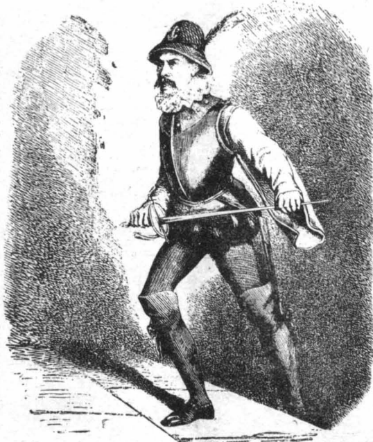
—Φεύγουν!... Ξεφώνισε ένας από τούς φρουρούς, τρέχοντας έμπρός...

Ήταν... έτοιμος νά τώ άνοιξη πειά, ενώ μικροδύσε στανόνες Ιθρώτος—σημείο άνεκφραστης, συγκλονιστικής ψυχικής ταραχής γι' αυτόν!—άρχισαν νά λάμπουν στό υπέρηφανο μέτωπό του, να γούλευε τή σφραγίδα και τά ψευκοκίτρινα σάν πώματος δάχτυ-