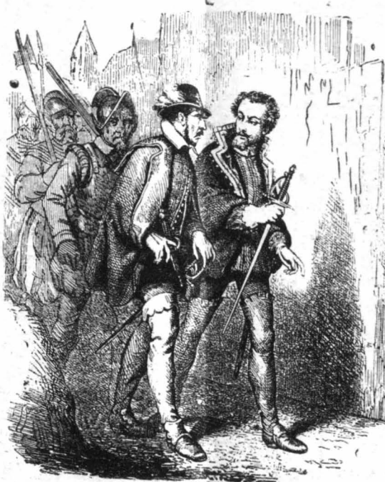
Χωρίς καπέλο και με τό ξίφος στο χέρι.