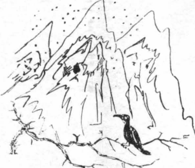
Τριγύρω τά βουνά, σάν γέροι πού έσηπιασε με τά νυχτιά τους !...

‘Οταν έφευγα, ό ούρανός είχε καθαρίσει, καί τι άστέρια με κούτσουαν από πάνω, ειρωνικά, σάν γά με περιγούλιουσε πού έφευγα. Δέν προ- χωρήσαμε δυος πούλι, καί μιά άρχισε τό χιόνι. Ψηλά, διόλιε, τριγύρω, τά βουνά, σάν γέ- ρος πού ξυπνήσανε με τά νυχτιά τους. Κάτω μιά άσπράδα άπέραντη σκόταζε δίλο τόν κήμο, όσο έπαυσε τό μύτι μας. Κροιστάλλα σέ κάθε μάξιμα νερού. Μιά γούβα με βροχιόνερα έδώ, είχε μεταμορφισθή σέ όλοστρόγγυλο, χορητάλλο καθρέφτη. Κάτω χαμιάβλα ίριδίσαν έδώ κι’ έκει, από τόν πάγο, πού καθόνε άπάνω της, καί σταφυρούσανε, θά νομίζε κανείς, στό πέ- ρασμα του τρένου, σάν μπαλαρίνες με κάτα- σπρα μεταξάτα φορέματα, γεμιστά πούλιες ά- σημένιες. Παρωκάτω ένα κούτσουρο, κορμός κομμένο δένδρον, με χιόνι ν σαφιασμένο στη μούρη του άπάνω, πούμιαζε με άσπρα προσοπίδα. - ‘Εχει καί ή φύσις ‘Αποκρηές έξέπληττα !