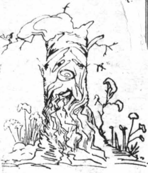
‘Ενα κούτσουρο, κορμός κομμένο δένδρου, με χιόνι, στη μούρη του, πούμιαζε με ά- σπρα προσοπίδα...