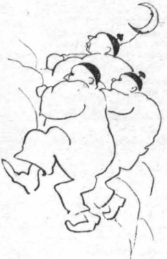
Μιά σειρά καταλεύκων περτότων, πού φαίνονταν σάν νά χορο- πηδού...

Τό τραίνο τώρα σαφραλώνει στό βου- νά. Κά πού θά είνε ή Λαμία, βέβαια... Κάτω διόλιση ή γή, σάν σκαλισμένη με σεντόνια... Σεντόνια καθαρά καί κά- τασπρα !... ‘Αλλά όσο προχωρούσε πρós τά κάτω, τόσο τό χιόνι τό κρατούσε γιά τόν έαυτό τους τά βουνά. Κάτω αί κω- ποί τώρα είνε με πρόστα τετράγωνα, κωκωνάκι, σκούρα, καφέ, μαυριδερά, καλλιεργημένα ή ακαλλιεργητα χωρά- φια, σάν τεράστιο τραπεζομάντηλο. Καί