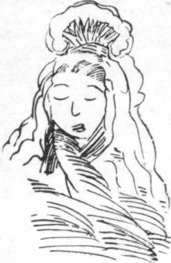
Σάν νύχη Καραγκούνισσα, λίγο χοντρή καί στίβαρη...

- Είσαι δυασροστιμένος, πού ταξιδεύεις τίς ‘Αποκρηές, ή μη νομίζεις πώς θά κωλύεις άγώτερο άν ήσουν στην ‘Αθήνα ; Πάγοι κι’ έδώ, πάγοι κι’ έκει !... Χιονώχτες έδώ, πού λύθονε σέ πρώτη έπαφή, πρόστα έκει, πού χάνοντα, πού γίνοντα κατόαν άναμνή- σις καί σπάζε... Τί θά καταλάβαινες ; ‘Από- λαστο, τουλάχιστον, τή φύσι μεταμορφωμένη... Είνε τόσο ποιητική καί τόσο είνε πού όφρα ζαή ή μεταμορφίσι !... Για κίταξε έκεινες τίς λαματιάδες τίς διόλιτες, πού στεκονται έ- κει πέρα !... Παλιόσκια είνε, χυθιά καί τα- πεινά. Κι’ όμως, έχουν τόσο γούστο, στό τυ- πιό τους, τό ‘Αποκρηάτικο !... Σε πούν ‘Α- θηναίο μασκαρά θά εφίσησε τή λεπτότητα αυτή καί αυτή τή χάρη !... Γιά κίταξε έκεινή τή μικρή τή λήνη, πού τής βάλαμε μαμαρένα από χόνι κορνίζα, γύρω, τριγύρω της !... Καί κίταξε την, τώρα, Ξαπλο- μένη μακάρια καί ήδονικά, περιμένη νά φάγουμε καί σύννεφα καί ν’ άντικαταστή- ση μέσα της τόν ούρανό, καί νά χορηγή βαβεια στό λά- γνα, θά νομίζε κανείς, τά στενά της, τόν ήλιο... Πα- ός ‘Αθηναίος μασκαράς σου δίνει τήν εντύπωση αυτή ; - Κανείς !... - Για κίταξε καί έκει κά- τω την κατεινή έξείνη καλύ- βα του φτοχού ! Παλατάκι κίταστρο, μαμαρένο, πού τήν κάνανε άπόνη !... ‘Ας γίνει κι’, αυτός ό δυστυχής πυργω- δεσπότης καί αφέντης, σέ μαμαρένο παλάτι, μιά φο- ρά !... Τό χιόνι του άσπρί- ζει, έστω καί για λίγες ώ- ρες, μαζύ με τήν κιάβα καί τήν κατάμαυρη καρδιά του ! - Τό πιστεύεις ; Δέν του