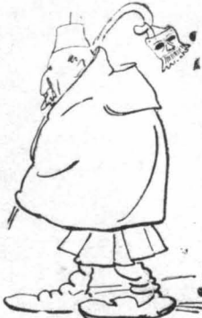
Καί με φλοκιάτα άρκουθόβλα- χου !...