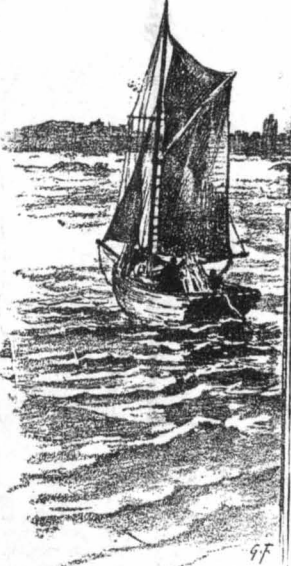
Σέ λίγο ή θάρκα βρισκόταν έξω από τό λιμάνι...

Κι' ό ψηλός Λουάρν ποδς κινδυνέψει γιά νά σώση αυτόν που τοκίλεθε τήν αγάπη του, δέν πόνεσε πειά μόνο σκέφθηκε πώς άλήθεια είνε παράξενα πλάσματα ή γυναίκες."