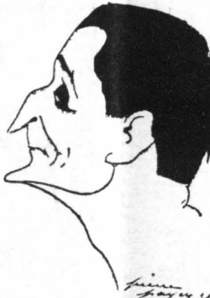
Ο Άντρέ Μπωρέ, τής «Όπέρ» - Κομίκ τών Παρισίων κ' άπό τούς γνωστότερους εστέρας τού Γαλλικού κινηματογράφου

— Ένας όμορφος άνδρας μ' άμείνει πάντα άσχημίνη, γιαντί σήμερα στην πόλ τόν κινηματογράφου υπάρχουν πολλές χιλιάδες άπό αυτούς. Δέν είνε διπλάδι ή άρωαότης κάτι άσυνήστο, που θά μπορούσε γιά μία κινήση τό ένδιαφέρον. Τό ίδιο ή ένας πλούσιος άνθρώπος. Γιαντί γιά μία γυναίκα που έχει μεγάλη περιουσία, τά πούτνια δόρα κα' ή άσχημη απαιτήση τών άνετών δέν τής κάνουν κομμάτι έντόπου. Φτάνει μάλ στα μέγχα τόν σημείον γ' άναπαθή τόν πλούσιον φίλο τής, όταν καταλάβη τό θά κάνει δι' αυτό γιά νά τής κινήση τό ένδιαφέρον κα' νά τήν καταστήση. Ο Τρέϊμς Σάουθον δέν είνε ούτε τό ένα ούτε τό άλλο. Γι' αυτό ποί κινήση τό ένδιαφέρον. Τόν γνώρισα γιά πρώτη φορά έδώ κα' έξη μήνες στη Σέντραλ Σιφίτ. Θυμάμαι ότι κάπως βιάζα στη λεωφόρο, είνε έναν άνδρα μ' άσχημίνην έν' ατακίνητο με μία άλωσιδα, ένν ένα σωφό Άμερικανού είχαν σταθή και τόν έθαυμάζα. Καθώς ήθαθα, αυτός ό δυνατός άνθρώπος ήταν ό σοφφέρος τού ατακινήτου, που είνε χαλάσει, και προσπαθούσε νά τό βγάλη άπό τόν κεντρικό δρόμο τού Χόλλυγουντ, τραβώντας τόν πάν παγινιδάκι, με τό ένα χέρι του. Παρακολούθησα τόν Τρέϊμς Σάουθον άραχή ώρα. Τέλος δέν μπόρεσα νά συγκαταστή τό θαυμασιόν μου. Τόν πλησίασα λοιπόν και τού είπα : «Είμαι ή Κώνστανς Μπέννετ. Θέλω νά σάς γνωρίσω. Ελάτε στό βίλλο μου άμα πάτε γ' αυτοκίνητό σας στό γκαράζ». «Εκείνος μού ά-