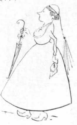
Σὰν φουστάνι Ναφιώτισσας φεσοῦς!