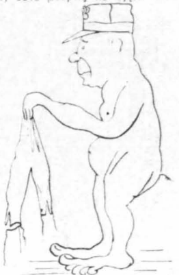
Ἡ πόσα ἀπύλα παρεῖδων ὁ Παπαλιάκης...