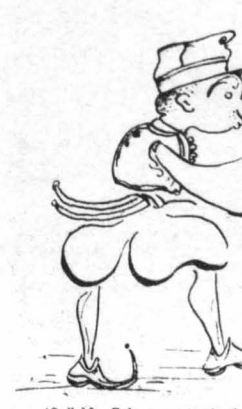
Ὁ Βελλή-Γκέκας, πού σὲ κἀνῃ εκιοφτῆ με τὸ μπαλάντ του!...