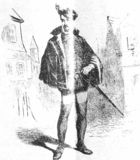
Ο δούκας Άγκου

— Κύριε! ειπε τότε ο πρώτος εϋπατρίδης. Όρείλω να σας ειδοποιήσω, ότι οι σύντροφοι σας, οι όποιοι έπετήθησαν απ' τό δρόμο, έφυγαν!... Ο άρχηγός τους εϋλοκοπήθηκε κατάλληλα κι' έφυγε κι' αυτός!... Κι' εσείς, ο όποιος θελήσατε να μιά