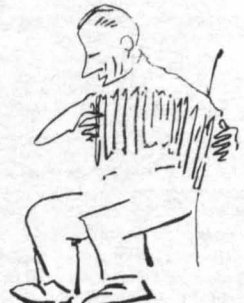
Ο Μπαρμπα - Γιάννης ο "Ασπρο- μάλλης, από την "Αδριανούπολι !

Λέγεται Μήτσος ή Χαράλα- μπος; Ένα από τά δύο. Μορφή "Ηπειρωτική, καταγωγή άπρο- οιδόριτος, πρόσωπο στεγνωμέ- νο, χαρακτηριστικά άνθρωπου πού δούλεψε, κουράστηκε και