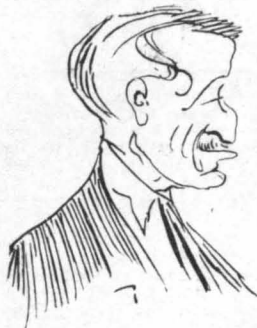
Ο Κύρ - Χαράλαμπος ή Κύρ - Μη- ταος, του ζυθοσιτατόριου ή «Λιμε- ρικη»