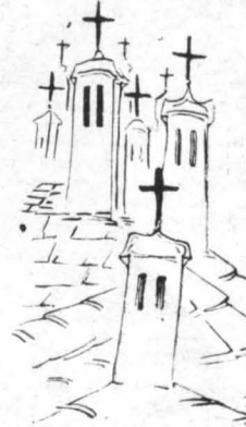
Σταυροί, σταυροί, σταυροί, έπρόθελλαν από παντού.