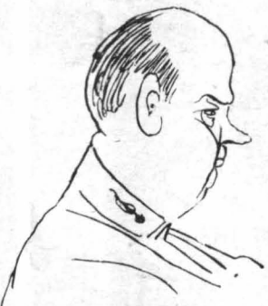
Το κάπνυμος έτρωγε μία τεραστία γλώσσα