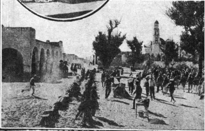
Στό φιλμ «Βίβα Βιλλάς», που ευριστηκε στο Μεξικο, ο Ουάλλας Ριθέρυ και οι άλλοι ήθοσοι κινούνεσαν να σκοταθούν σέ διάφορες ψευτομά χες, από τους Μεξικανούς κομπάρσοος, οι όσοιοι είχαν πάρει στα σοσάρα τό ρόλο τους