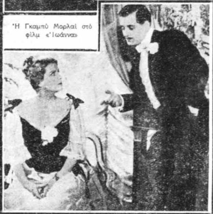
ΕΠΑΝΩ και ΚΑΤΩ : Δύο άλλες σκηνές από το φιλμ «Ιωάννας»