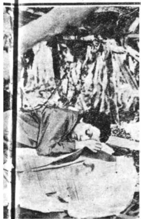
Στο φιλμ «Μπολερός», στο οποίο πρωταγωνιστούσε μαζί με τον Τζωρτζ Ράφτ, η Καρόλ Λομπάρ φορούσε τακούνια τόσο ψηλά, ώστε κάθε βήμα της ήταν μαρτύριο