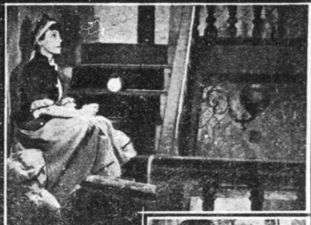
Η Γκαμπό Μαρλαί στο φιλμ «Ιωάννας»