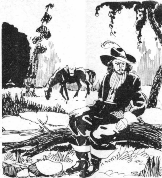
Ἐκεῖ βυθίστηκε σὲ σκέψεις...