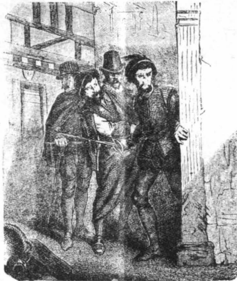
Τους βρίσκουμε στην όδον Σαινταθουάν, νά παραμούνουν...