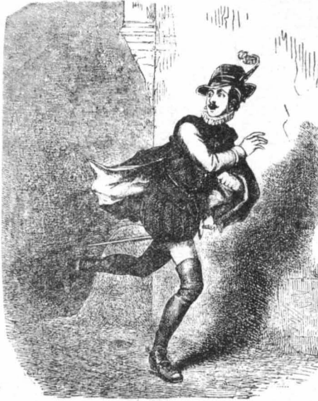
Ὁ Μονταριὸλ ἔφυγε τρέχοντας καὶ ἐξανικύτταε ἀπὸ χαρά...

—Ἀχ, τί νὰ πᾶ τώρα σὸν καρδινάλιο!... Αὐτὸς ὁ ἀρχεῖος ὁ Ρασκάκι, θὰ γίνῃ ἀρχηγός μου, θὰ πᾶρῃ τὴν γενναῖα χρημα- τικὴ ἀμοιβὴ καὶ τὴ δόξα τῆς ἐπιτυχίας!... Ἐνῶ ἐγὼ θὰ πάρω