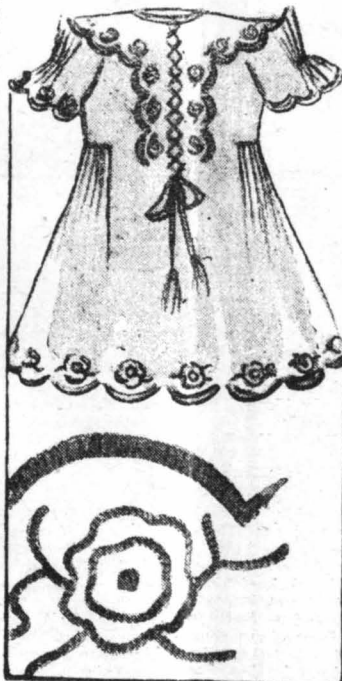
Φορεματάκι από βουλά ή κρέπ - ντε - οιν, κεντημένο μέ τό σχέδιο ή δέντρον, σέ βελούδο φασοκίνο.