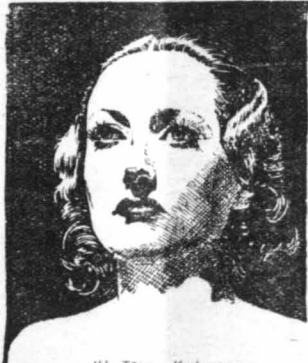
Η Τζόαν - Κράουφφοντ

Η Κόνσταντ Μπένετ, η εβεντίνα με την πολύ παράξενη φωνή, που ξετρολλάινει τους θαυμαστές της με τα εθίμα τραγουδία της και του χορού της, ανεργάζεται σήμερα από αστόντιωσ της εταιρείας της μαζί με τον Κλάρκ Γκέμπλ. Οι δύο «άστέρες» όμως έχουν τελείως διαφορετικούς χαρακτήρες, κι αυτό τους έκανε να συμπληρώσει ο ένας τον άλλο τόσο πολύ, ώστε να δώσουν άφορη στίς κακιές γλώσσες του Χόλλυγουντ να διηγηθούν πολλά πράγματα εις βάρος τους. Λένε δηλαδή «τι ο Κλάρκ Γκέμπλ, που ως τώρα ενδιαιρούταν υιο για τις σαβαρές και μορφωμένες γυναίκες, άλλαξε ξαφνικά ιδέες κι ευχαριστείται με τη συντροφιά της Κόνσταντ Μπένετ, που είναι πολύ παράξενη, πολύ ιδιότροπη, και που ανόητος σκαρώνει ξεκαρδιωτικές φράσεις στους φίλους της. Άλλοι πάλιν βεβαιώνουν ότι ο «έρωσ» των δύο «άστέρων» προέρχεται από ένα στοίχημα, που είχε βάλει η Κόνσταντ Μπένετ με τον Τσαρλ Ρίνγκεν, τον πιο σφοδρό φίλο της, ότι θα κατόρθωνε να πετύχει την κατάκτηση αυτού του σαβαρού γόητος. Όπως κι αν έχει όμως αυτή η υπόθεση, το αποτέλεσμα είναι ότι οι δύο «άστέρες» από αγνώστους της νέας ταινίας τους έγιναν δύο υπερφίλοι και διόλου άπεισαν τον ειδικό τους να συνεχισθεί πολύ καιρό ακόμη.