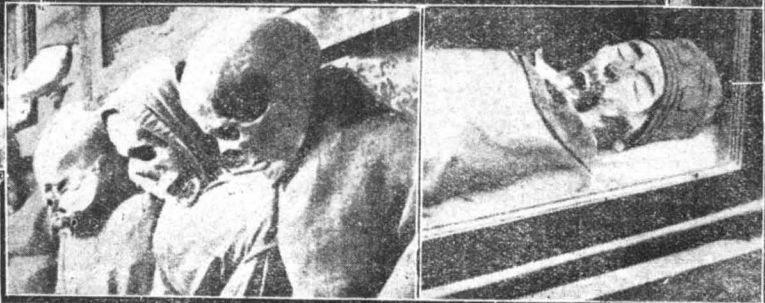
Μούμιες μοναχῶν, πού ἔχουν λυθεῖ ἐντελῶς, και ἀποκαθάνοντ προ τετρακοσίων ἡ μούμια τοῦ πρώτου ἡγουμένου τοῦ μοναστηριου, ἐτῶν και πλέον 1...