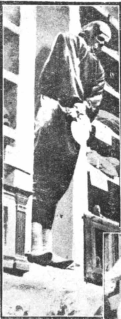
Ἡ μούμια ἐνὸς μοναχοῦ στίς περιφημες κατακόμβες τοῦ μοναστηριου τῶν Καπουκίνων, στὸ Παλέριο