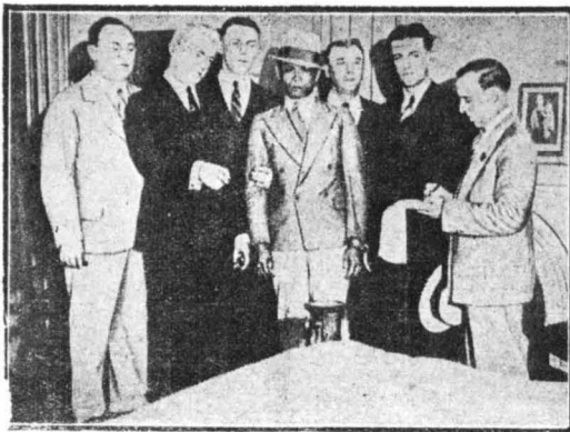
Ο Τζιόγκαν τόν έπιανε άποτυμα άπό τό χέρι και δείχνοντάς τού τό κρεβάτι τού δόκτορος, τού είπε...

Πώς ήταν δυνατό ένας εγκληματίας που άνθεσε σε τόσα θασασιότριά, χωρίς ν' άνοιξη τό σόμας τού, να ομολογήσει τό έγκλημα τού με μία άπλη άναπαράσταση; Μά ό Τζιόγκαν ποί ήξερε καλά τήν ψυχολογία τών μαύρων έπέμεινε και τούς άνέγκασε ν' άκούσουν αυτή τή συμβουλή τού. «Εται ό Τζώρτζ Ντάμιερ ώδηγήθηκε στο μέγαρο τού δόκτορος Ντέλυ» συνοδευόμενος άπό τόν Τζιόγκαν και μερικούς άστυνομικούς και