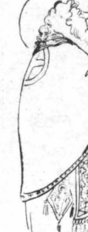
"Άλλοι ιερείς φάλλουν από μέσα από τόν ναό...."

—Οι Καβαλλιώτες, οι σπαταλούντες για τή ζωή, σαριμάζονε τις κουταμάρες του θανάτου. Ίσως να ξέρουν περισσότερο από κάθε