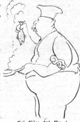
....Και άλλοι από έξω !...

—Μή τ'ά ρωτάς !... Πρώτα ήτανε χειρότερα !... Τώρα είν' άπ' έξω μονάχα πρατήρια. Πήρην ήτανε δύο και ταβέρνες. Κι' έτσι από μέσα ψάλλανε ('Η συνέχεια εις τήν σελ. 271)