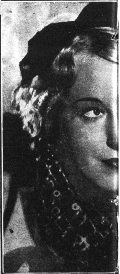
ΕΓΓΛΩ : Μιά γοητευτική Τσιγγάνα της Ίσπανίας, η οποία έχει ξεπεράσει τους Μαδριλένους με τους χορούς της. — Δύο αξιωματικοί των Σκότων Γραυλάτων «Σάουαρθς» στη Βρέμη. — Δύο χαριτωμένες Παρισινές με ποσοάκια της «Καμπί» απολαμβάνουν τον χειμερινό ήλιο της Κιστής Άσπης. — Μιά μουσική ηρώνα Κάρρα, όπως εμφανίζεται στο φιλμ «Σοφία». — Ο Περσικός πρίγκιπας «Ούμα» με τον αγαπημένο του σκύλο, ο οποίος τον έσωσε από την επίθεση δύο «Νύχτες Άγριες». — Η Άγγλις δημοσιογράφος Σίνθια Άλβαν, η οποία άνω θυμωμένη γιατί αυθόρμητα στο ντύσιμό της την απολέγησε με την κομμάτινα. — Η