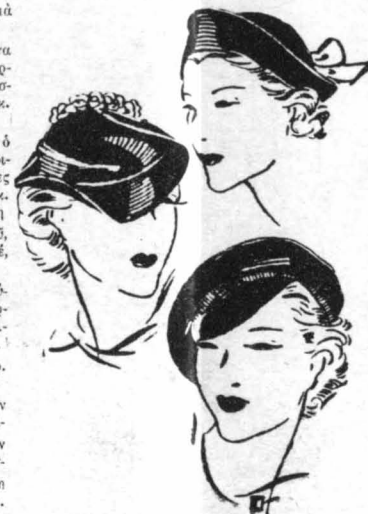
Καπέλλο από βελούδο μαρλίν, με φίλιγο λευκό πύσω. — Μικρό φάρμα από μαύρο πικό, γαυρημένη με ροζ κομμάτια. — Κοσκίνο Ρωσικό, από κατόν μαύρο, με γέλα από καπάλη.

Μεγάλον Μικρόν, Πειραιά. — Το άνάσπημά σας δέν είντε και τόσο μακρο για την ηλικία σας, αλλά μπουρείτε να ύποδοθηήσετε άόμοη την άνάπτυξή σας. Πρωτίστος πρέπει να τρέφθετε πολύ καλά και να παρακαλέσετε το γιατρό σας να σάς δώση ένα δυναμωτικό με φωσφορούχα συστατικά, για να δυναμώσουν τα κάκαλα. "Επίσης για κάνετε σπόρ και καθημερινή γυμναστική, έδως χειροπόδιση, αιώρησις, άλληρες κ, έπι, "Ετσι θα έβητε άνοητή άφρλη.