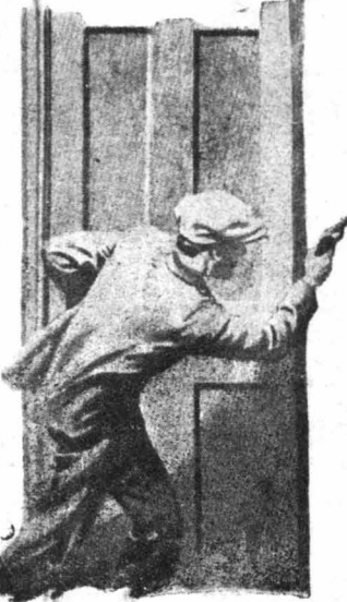
Μὲ εὐκίνησαι ἀλλοῦρον, ἀνέθηκα πατώντας τὴν σωλήναν τοῦ νεροῦ!...