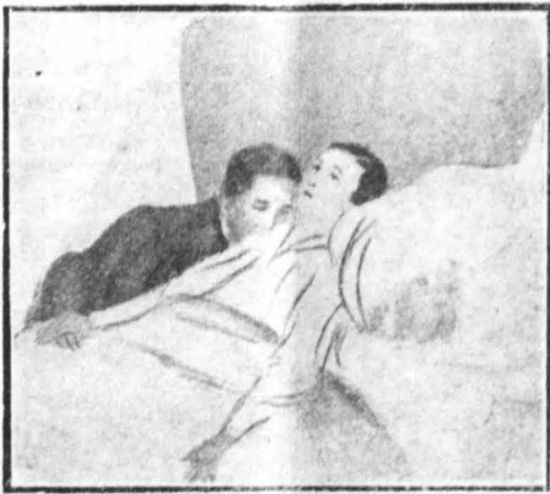
—Τι θές, άγάπη μου;...

—Αν ώστόσο, μου έπτε την άλήθεια ή γυναίκα μου; Αν τά γράμματα έκείνα ήταν δικά μου και δικά της;... Αν στην τελευταία έκείνη στιγμή της ζωής της, ή άπτασία κάποιας άλλης γυναίκας που νόμισε πως θά την άντικαταστήη, έμνησε μέσα της τή φιλοτιμία αυτή, στή την άνάγκη να φύγη από τόν κόσμο χωρίς ν' αφήση πίσω της τίποτα που θάκανε να χαμογιάλλω μιά άλλη γυναίκα εις θάρος της;»