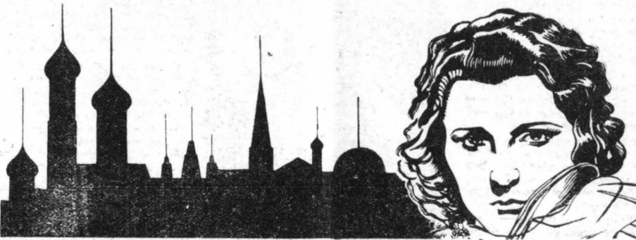
Η Μαρι Μπέλ, η όποια πρωταγωνιστεί στη «Φαυδώρα»

Η νέα «απαιτία» του Ραμόν Γουάρο, η χαριτωμένη Άγγιλιδα ηθοποιός Έβελιν Λάις, άρχισε να προσαμύεται στη ζωή του Χόλλυγουντ και να κάνει ένα πλήθος έξομφρε υσιούς. Έτσι κατέκτησε την σμη να φειτώ των «αδελφών», γιατί μπορούν πιά να όηγούνται και γ' αυτήν ένα σωρό συναρπαστικές περτέτες.