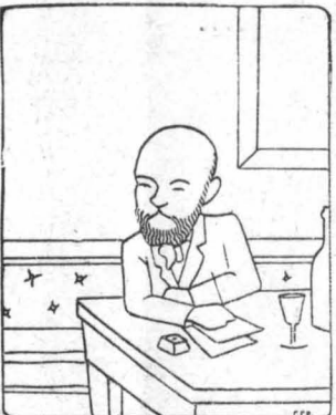
‘Ο Βερλαῖν στὸ ‘Καρέ ντὸ Γκάζ’, ἔπου σῶνῶσε

Γι’ αὐτὴ τὴ δουλειά, ποῦ βαστοῦσαν μῆμιση-δύο ὄρες καθημερῶς, ὁ Βερλαῖν ἔκαινε ἐτησίως 2.000 φράγκα, μισθὸ ἀρκετὰ καλὸ γιά τὴν ἐποχὴ ἐκείνη.