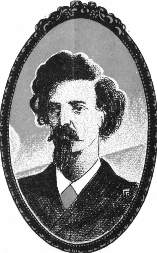
Ὁ Ἀχιλλέως Παράσχος (Σκίτσο τοῦ κ. Γ. Γρηγοῦ)