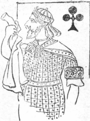
*Ένας τραγογής ρήγας μου τό άρπαξε!...