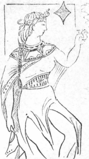
Μιά σουφραζέττα ντάμα μου τό άρπαξε!...

-Τό σακκάκι, που πάει; Ρώτησε ό παγκέρης, χωρίς νά καταδεχτή, όποτε νά μέ κυτάξει. -Στό έννηά, είπα μέ τή ψυχή στό στόμα. -Τέρσο-τίρο έννηά!... 'Ο χοντρος άντίχειρ του παγκέρη, άρχισε νά σύρη ένα-ένα τά χαρτιά. 'Ενόμιζα πως τραβάει τά φύλλα...της καρδιάς μου. Καί πονούσε ή καρδιά μου καί πονούσε... -Τό έννηά τρίτσο! 'Ήταν ή φωνή ή άναγγέλλουσα ότι έμεινα πειά όριστικός μέ...τό γιλέκο! Είπα τό σακκάκι μου νά φεύγη καί νά άπάγεται όπωσ ό θυγατέρες των Σαβίνων... 'Η πρώτη σκέψη μου όστόσο ήταν άν όπηρε καί τίποτε άλλο έπάνω μου, γιά νά τό παίζω.