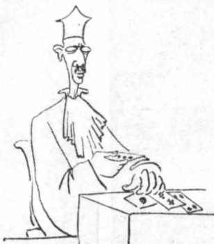
Μέ σεοβαρότητα προέδρου 'Εφετών, φορούντες μάλλιατα καί τήθενον...