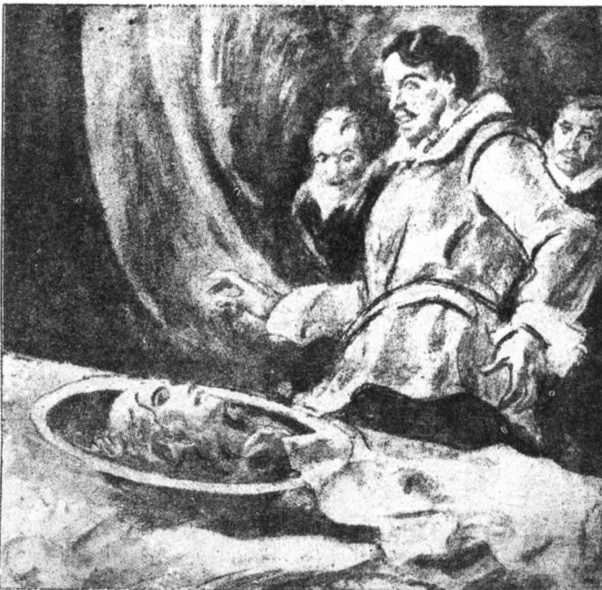
Μέσα στὸν ἀσημένια δίσκο ἦταν τὸ κεφάλι τοῦ «Ξανθοῦ Χερουβείμ»

—Μὴ μὲ σκοτώσετε !.. Ἐλεος !.. Ἐγὼ μιὰ ἄλλη ζωὴ μέσο μου. Θὰ πρῶσω ἕνα παιδί στὸν κόσμο ! Μὰ ὁ Βαρθολομαῖος τρίζοντας τὰ δόντια του ἀπὸ τὴ λύσσα τῆς ἐκδίκησης, γιὰτὶ κατάλαβε ὅτι τὸ παιδί ἦταν τοῦ Σαλιάτι, τῆς κάρφωσε τὸ σπαθὶ οὗτὴν καρδιά καὶ ὕστερα σὺν δήμιος, τῆς ἔκοψε τὸ κεφάλι. Ἐπειτα τὸ ἔριξε μέσα σ' ἕνα σακὶ καὶ τὸ παρέδωσε στὸς συνενόχους του γιὰ νὰ τὸ πᾶνε τῆς Βερόνικας. Πρὶν ὄμως, μὲ τὴ βοήθειά τους, ἔριξε τὸ ἀσφάλιο σῶμα τοῦ «Ξανθοῦ Χερουβείμ» καὶ τὸ αἰμόφυγο πτώμα τῆς δούλας στὰ βαθειὰ νερὰ τοῦ Ἄρνο... ***