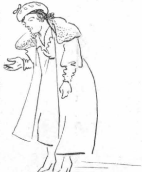
Μιά δασκάλα προσευτική, πού ήρθε στό χωριό!...