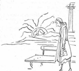
Κι' ή 'Αστερω έθυσε στον ούρανό τής δυστυχίας, στην 'Αθήνα...