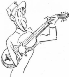
Κοιμήσου, αγάθη μου γλυκειά!...