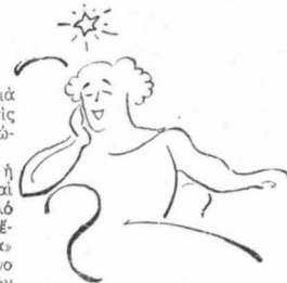
Θά γίνης «άστέρω» πρώτης τάξεως!...

—Χαζό παιδί!... Είνε μεσάνυχτα» άρχίζει τό