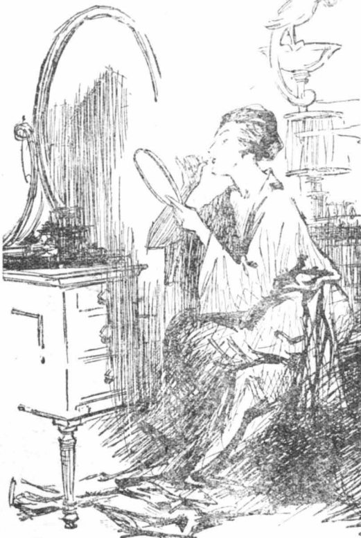
'Η χορωρία με τó πεινούάρ έβλεπε εκείνη τήν ώρα τά χείλη της

—'Ο κ. 'Ανσέλιο, έξακολούθησε ή Λουκιανή, έπαιξε, όπως θά ξέρετε, στον κινηματογράφο. Μοι έλεγε λοιπόν πολλές σορές πώς έγώ φωτογέμεια και πώς θά μπορούσα να σημειώσω έπιτυχία στην θόνη... Κάθε φορά τού άπαντούσα ότι δεν έπιθυμούσα να παίξω στον κινηματογράφο, άφοο άλλωστε ή συνεργασία μου είναι άπαραίτητη στον «'Αρχοντα τού Μυστηρίου»... Άπό περιέργεια μόνο, παρακάλεσα τόν κ. 'Ανσέλιο να μοι έπαιρνε μερικά μέτρα ταινίας, για να δω τόν εαυτό μου στην θόνη... Λοιπόν τήν Τσίτη, ο κ. 'Ανσέλιο μοι τηλεφώνησε για να πάω τήν άλλη μέρα σ' ένα στούντιο τού Ναιβόν. όπου είχε φωνήσει να παίζω δοκιμαστικά... Δέχτηκα... Και πήγα στις πέντε τó άπόγευμα στο διαμέριμα τού κ. 'Ανσέλιο, για να τού ζητήσω μερικές πληροφορίες σχετικώς με τó κοστούμι που έπρεπε να φορέσω, τó μακιγιάρια κτλ. 'Η έπισκεψι μου δεν βάστηξε παρά λίγες μόνο στιγμές... Όταν ο σύζυγός μου έπέστρεψε... (Άκολουθεί)