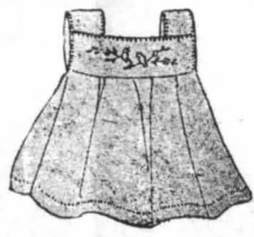
ΤΑ ΜΟΝΤΕΡΝΑ ΚΕΝΤΗΜΑΤΑ

'Ὅποτε θέλετε νὰ εἶνε πολὺ φρέσκο τὸ πρόσωπό σας, ἀλείφετε τὸ μ' ἕνα κρῶκὸ αἰγῶν, στὸν ὁποῖο ἔχετε χτυπήσει μὰ κοιταλιὰ ἐλαιόλαδο καὶ μὰ κοιταλιὰ eau de laurier - cerise. Τὸ πρωὶ, ἀντὶ νὰ πλένετε τὸ πρόσωπό σας, νὰ τοῦ κάνετε κομψέσους ἐναλλάξ με ζεστὸ καὶ κρῶκὸ νερὸ καὶ ὅταν τελειώσετε, τοῦ βάζετε καλὴ λίγη κρέμα. Τρῶπε πολλὰ φρούτα καὶ ὅποτε εἰσθε ἐλευθερὴ κάνετε ἕναν ἐξοχικὸ περίπατον.