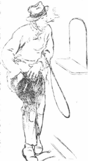
Ο οδηγός είχε κατεβή για ν' άγοράση κάτι.

«Ο νεωσιτά παθών έξ άρτηραιοκλήρωσεως νεωκόρος του ναού του Μοναστηριακού, ερχεται έτη πολλά και εύχεται στους άγαπητοτάτους ένοριτάς!...»