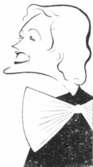
Marie Davies Η Μάριον Νταϊέις

Και τώρα, ως σάς αναφέρουμε την τελευταία τραγωδία του Χόλλυ- γουντ. Τό θήμα της είναι μιά όμορφη Γαλλίδα, δεκαετώο χρόνων, που είχε ξαναήσει δώ κ' έξη μήνες από την πατρίδα της, με την έπιθυμία να παΐξη στον κινηματογράφο. Άλλ' ή φιλιόπολις, ως γνωστόν, πύ- σω από την άγλη και την μεγαλοτηρητή εμφάνισι τών «άστέρων» της, κρύβει μιά τρομαχτική δυστιχία. Χιλιάδες φτωχών κοριτσιών βρίσκου- νται χωρίς δουλειά και πεθαίνου από τις στερησις και την πείνα. Ό- λες αιτές μοιάζου με τις χρυσάλλιδες, που καινε τά σπέρτα τους στο φός. Μιά τέτοια λοιπόν ήταν κ' ή Λουσι Φάιτνι, ή όμορφη Γαλλίδα που άναφέραμε. Αιτοκίνησαν στο φτωχικό δωμάτιο της, ύποπτημενί- λι από την τύχη της κ' αφού μάταια προσπάθησε να βοή έστο και μιά θεοι κοιλάρσος στα εσοτήνιος του Χόλλυγουντ. Μά κανείς δεν προ- σέχει αυτά τά δρώματα. Όλοι ένοδιαφέρονται για την έκνετηρη ζωή των μεγάλων εστέρων, που άνασταίνου τον κόσμο με τις ύδιοτρο- πίες τους και τά σκάνδαλά τους.