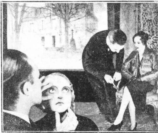
Ίατρική εξέταση τοξικομανών γυναικών

Έκει πέρα βασίλευε μιά άγωνιώδης σιωπή. Άπότομα, άνοιξε μιά πόττα και μιά νοσοκόμα, με το δάγτυλο στα γείλη, μιά έκανε νόημα να σωπάσω. «Εσσιζα μιά υατιά από τή μισανοινητή πόρτα, μπροστά στην όποια στεκόταν ή νοσοκόμα. Το δωμάτιο ήταν έπιπλωμένο με πολυτέλεια: πίνακες ζωγραφικής, βιάα με λουλούδια, άμορφα γαλιά. Δίπλα, ή σάλλα του υπάνου άσπρωτε από τή νίκελ και τις άσπρες προσελάνες. Μά, ένας στεναγμός τράθηξε την προσοχή μου. Πάνω στο κρεβάτι ήταν εξαπλωμένη μιά νυνάικα. Το πρόσωπό της μόλις ξεγύριζε ανάμεσα στα κάτασπρα σεντόνια. Μόνο δυό μενάλια μάτια ζούσαν σ' εκείνο το κεφάλιο ποό σπομο. Αυτά τή μάτια έκποάφαν την άγωνία και τον πόνο. Ήταν ή νεοφερμένη άγνωστος.